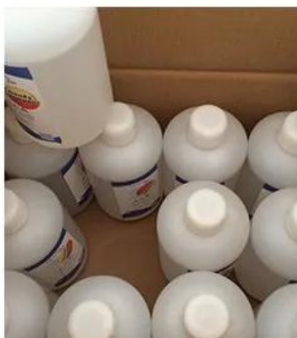
Show de fábrica

FÁBRICA DE MOSTRA (clique na foto abaixo para ver mais)